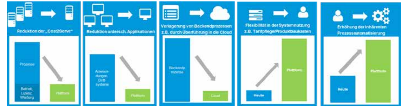
Interne Auswirkungen durch die Nutzung der IT-Plattform NextGen

Neben den auf regulatorische Vorgaben ausgelegten Basisfunktionen ermöglicht NextGen auch die Ergänzung von auf die User*innen zugeschnittene Zusatzfunktionen. Somit können diese sich voll auf ihre tagesgeschäftlichen Aufgaben konzentrieren und werden nicht durch überflüssige Funktionen gestört. Wirtschaftsprüfer-Reports und andere Auswertungen können ohne zusätzliche manuelle Arbeit per Click gezogen werden und sind immer abrufbereit.